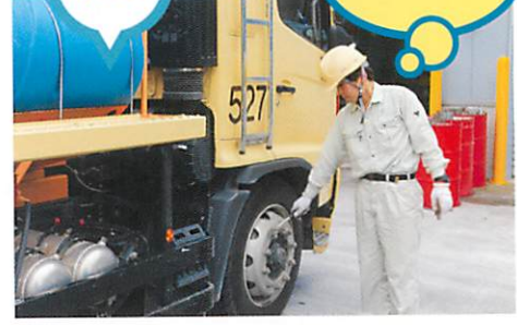
オイル漏れやタイヤの空気圧、ナットの緩みなど車周りをチェック