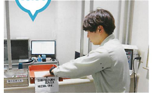
車両を清掃し日報を提出する