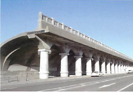
▲ 北防波堤ドーム [北海道]

北海道稚内市にある古代ギリシャ建築の柱列を思わせる防波ドーム。稚内港の防波堤として1931年に建設された。現在は北海道遺産に指定され、様々なイベント会場となっています。