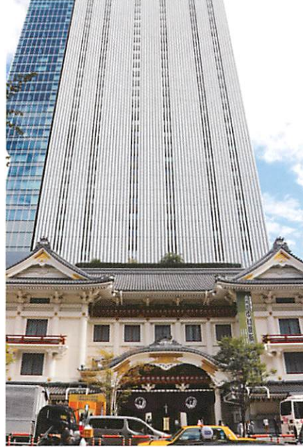
▲ 歌舞伎座 [東京都]

北海道稚内市にある古代ギリシャ建築の柱列を思わせる防波ドーム。稚内港の防波堤として1931年に建設された。現在は北海道遺産に指定され、様々なイベント会場となっています。