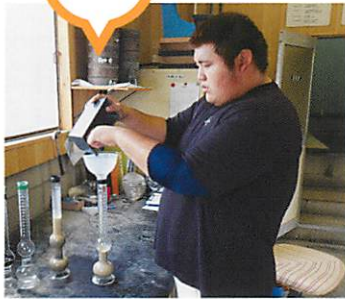
材料試験(表面水率試験)