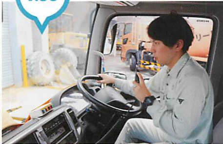
当日の出荷数量によるが午前中は2~3回現場と工場を往復して生コンを運搬