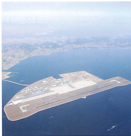
▲ 中部国際空港(セントレア空港) [愛知県]

建設：2012年5月22日 高さ：634m 東京都墨田区押上一丁目にある電波塔。観光・商業施設やオフィスビルが併設されており、ツリーを含め周辺施設は「東京スカイツリータウン」と呼ばれます。2012年5月に電波塔・観光施設として開業しました。