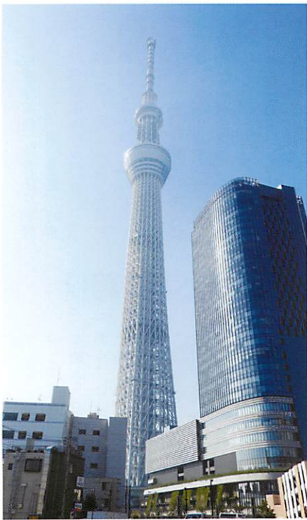
▲ 東京スカイツリー [東京都]

大阪市阿倍野区に立地。阿部野橋ターミナルビルの中核を担う。2014年3月7日に全面開業しました。日本で最も高い超高層ビルで、日本国内の構造物においても東京スカイツリー（634m）、東京タワー（333m）に次ぐ3番目の高さを誇ります。