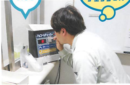
アルコールチェックの後に交通状況など当日の注意事項の指示を受ける