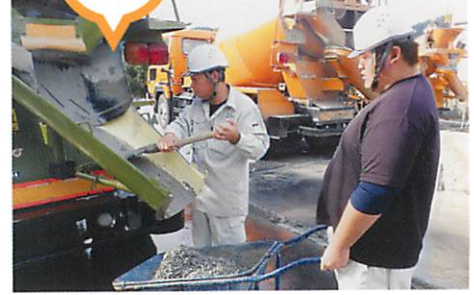
出荷する製品を検査するために生コンを採取