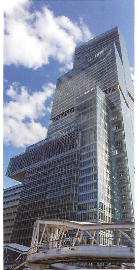
▲ あべのハルカス [大阪府]

東京都中央区銀座四丁目にある1889年に開場した歌舞伎専用の劇場。火災や戦災に遭うなど様々な変遷がありましたが、今日に至るまで名実ともに代表的な歌舞伎劇場として知られています。2013年に改築されました。