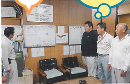
ミーティングで1日の作業内容を確認