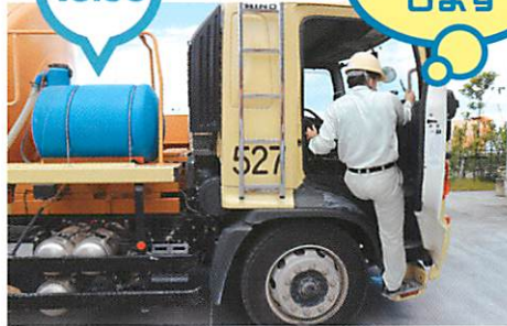
午前中と同様2~3回現場と工場を往復して生コンを運搬