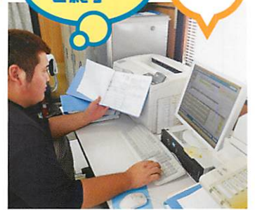
翌日の作業準備、書類整理