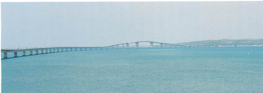
▲ 伊良部大橋 [沖縄県]

愛知県・知多半島の沖合に完成した人工島に設けられた海上国際空港(愛称は「セントレア」)。2005年2月にオープンしました。